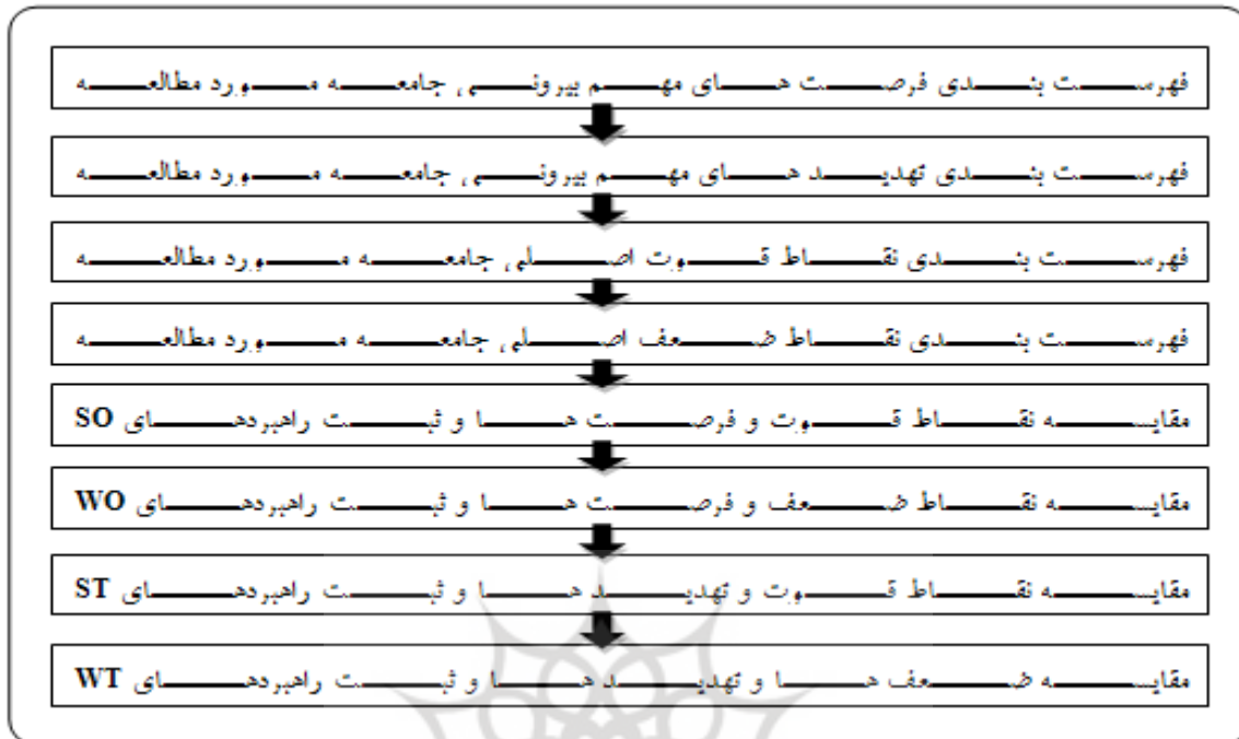
شکل شماره ۱- نمودار مراحل تهیه مدل سوات

۴۰). این تکنیک شامل یک فرآیند ۸ مرحله ای می باشد، که در نمودار ۱-۴ ارائه شده است.