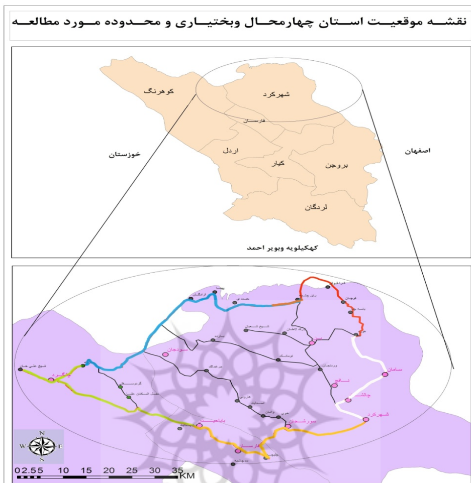
شکل شماره ۱- محدوده مورد مطالعه

مناظر زیبایی را برای مسافرانی که از این مسیر عبور می‌کنند، خلق می‌کند.