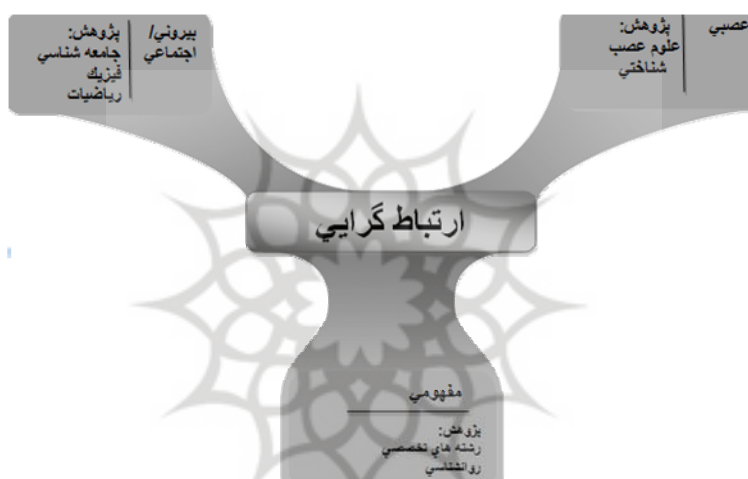
شکل ۲ ارتباط‌گرایی و سطوح شبکه

۳. سطح بیرونی. اطلاعات شبکه‌ها به طور قابل توجهی توسط توسعه فناوریهای مشارکتی شبکه، مورد حمایت قرار گرفته است. وبلاگها، ویکیها، برچسب‌گذاری اجتماعی و شبکه‌های اجتماعی اینترنتی، ظرفیت افراد را برای ارتباط با دیگران، متخصصان و محتوا افزایش داده است. فهمیدن و شناخت در معنای شبکه‌ای یک عنصر رویدنی (ظاهر شونده) ۱ است که به شکل و ساختار اطلاعات فردی و شبکه‌های اجتماعی یادگیرنده بستگی دارد.