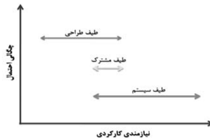
شکل ۱ طیف سیستم، طیف طراحی و طیف مشترک

با توجه به شکل ۱، مشاهده می‌شود که همپوشانی بین طیف طراحی و طیف سیستم، احتمال موفقیت یک سیستم در ارضای نیازمندی کارکردی مربوط به یک معیار را نشان می‌دهد (شکل ۱).