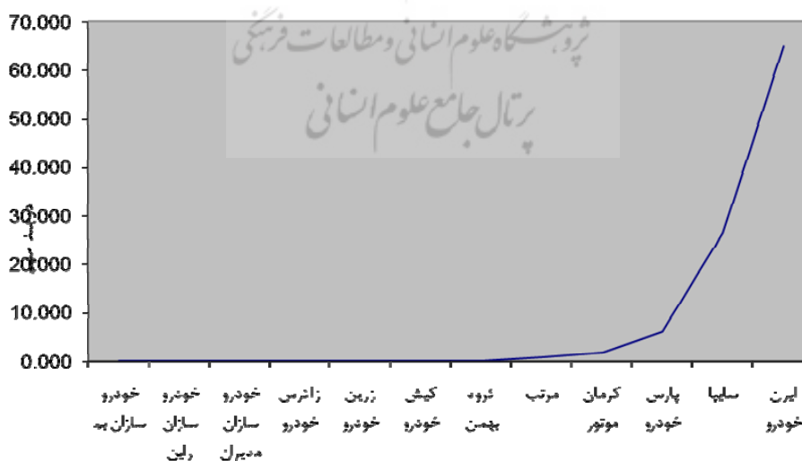
نمودار ۲: منحنی تمرکز سال ۱۳۷۷