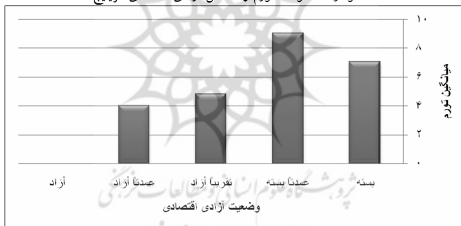
نمودار ۲: متوسط تورم و شاخص آزادی اقتصادی هریتج.