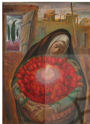
اثری از کاظم چلیپا