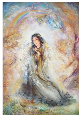
اثری از محمود فرشچیان