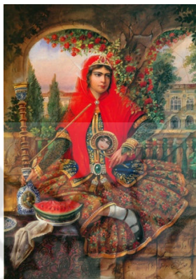
اثری از حجت‌اله شکیبیا