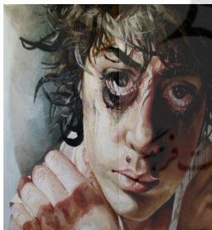
اثری از محبوبه بیات خردمند