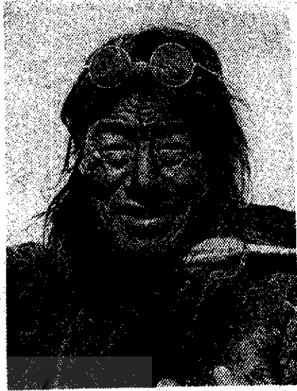
آنچوک - سرگردۀ شمن‌ها

وه! چون به خشکی برسم چه خوب خواهد شد، کی این سرگردانی به سرانجام می‌رسد؟ و ما - کی به خانه می‌رسیم؟ آنوقت چه خوش خواهد بود.