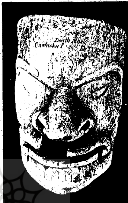
سورنگه ویژه نمایش های مربوط به سوئواری و مراسم

سدنا از پنجره ایگلوبه بیرون نگرست. جوان خوبچهره چشم در چشم او دوخته بود، جوان جرأت یافت... از سرزمین مدام بهاری که علفچرهای سبز و خرم - با کاریبویهای رشید بیکسر داشت، سخن ها گفت و وعده ها داد که طوق بندی از عاج به نشان همسری به سدنا ببخشد... سدنا فریفته شد. آرام آرام به سوی کایاک آن جوان غریبه به راه افتاد. جوان - دست او را گرفت و در سوار شدن به کایاک به او کمک کرد. کایاک از ساحل دور شد... رهگذرنا آشنا - سدنا را از ایگلوبه پدرش ربود در حالیکه در اصل پرنده ای درشت هیکل بود که به هیأت انسان درآمده بود. او این راز را از سدنا مخفی نگه میداشت تا اینکه سدنا حقیقت را دریافت. سدنا روزهای تلخی را با اشک و آه گذراند. آنگوستا ۱۴ - پدر سدنا - هم در فراق دخترش غمگین بود. روزی از روزها... آنگوستا