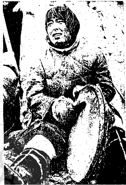
جوان اسکیمو، با ضرباهنگی که بر طبل می نوازد لهه سدا - ناز با نوبی شکار - را فرامی خواند

چراغ ها را در داخل ایگلوها خاموش می کنند. شمن ها ورد می خوانند. یکی از شمن ها زیر نظر شمن اعظم (= آنجکوک)، در نقش یکی از خدایان ظاهر می شود و سپس خودش را در گوشه ای از ایگلو یا پشت دیوار کمی در کلبه پنهان می نماید. سر کرده شمن ها به روح نیاکان درود می فرستد و از خدایان درباره زندگی مردگان درد نیای دیگر و وضع صید و صیادی و آینده زندگی اسکیموها سؤال می کند. شمنی که در نقش یکی از خدایان بازی می کند، به آرامی، پاسخ های مناسب را بازمی گوید، تماشاگران با شمن اعظم همسوازی می شوند و تحمل و صبوری را بهمدیگر سفارش می نمایند.