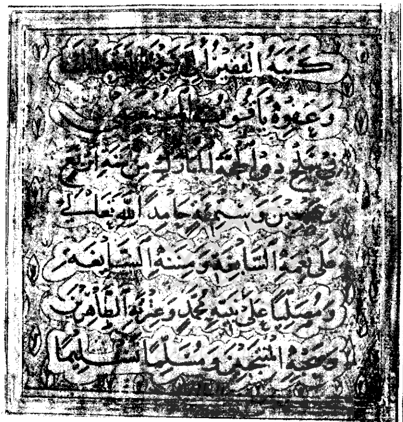
ترقیمہ قرآن بہ خط یاقوت مستعصمی

دورہ جدید سال سوم، شمارہ دوم تابستان ۱۳۸۴ (پہلی ۲۹)