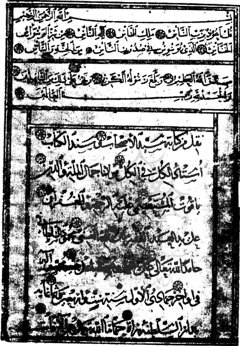
نقل از خط یاقوت به قلم محمود سلطانی، کتابخانه کاخ گلستان، قرآن شماره ۲.

دوره جدید سال سوم، شماره دوم تابستان ۱۳۸۴ (پیاپی ۲۹)