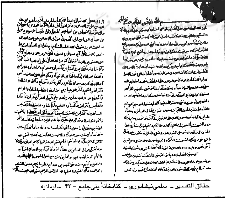
حقائق التفسیر - سلمی نیشابوری - کتابخانه بنی‌جامع - ۴۳ سلیمانیه

۱۲. اما این همه ماجرا نیست؛ مراجعه به متن حقائق التفسیر ما را با نام‌هایی روبرو می‌کند که پیش از هر چیز یادآور آموزه‌های گنوستیک حلاج‌اند؛ نام‌هایی چون ابن عطا الادمی (م ۳۰۹ ق) یگانه مدافع حلاج در برابر اتهامات وارد بر او که به همین دلیل در آزمون مرگ نیز با وی یار شد؛ واسطی که به تحقیق لوئی ماسینیون همان محمد بن عبدالله هاشمی (م بعد از ۳۲۰ ق) گردآورنده آخرین آثار حلاج - و از جمله کتاب طواسین - است که در اهواز و بصره عهده‌دار امور حلاجیان شد؛ ۹ فارس بن عیسی که به نشر عقاید حلاج در خراسان همت گماشت و در دفاع از آموزه‌های او کتاب‌هایی نگاشت که به جز سلمی، ابوبکر کلابادی در کتاب التعرف خود از آنها بهره گرفت؛ ۱۰ و نصرآبادی که پیشتر از او یاد کردیم و از پیروان حلاج بود. توجه به این نام‌ها و نام‌های دیگری که ذکرشان مجال دیگری می‌طلبد، ما را بر آن می‌دارد که این تفسیر را «تفسیر حلاجیان خراسان» بنامیم؛ اما اگر بی‌مداقه