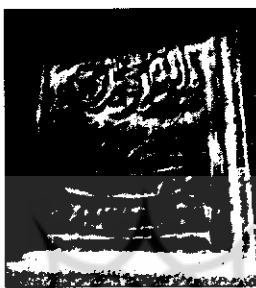
نشان کتابخانه‌ی غازی خسرویک

اسناد محاکم شرعی بوسنی و هرزگوین سالم ماندند.