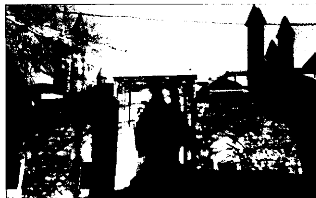
کتابخانه خسرو بک