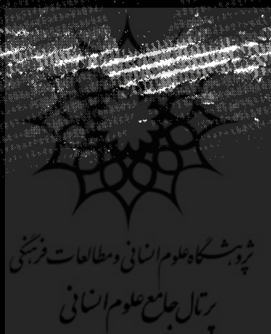
دسته خنجر لعل ( از نفائس موزه آستان قدس )

و بموجب قانون مصوبه همان سال بیانك ملی ایران منتقل گردید ، قسمت عمده جواهرات سلطنتی ایران بود .