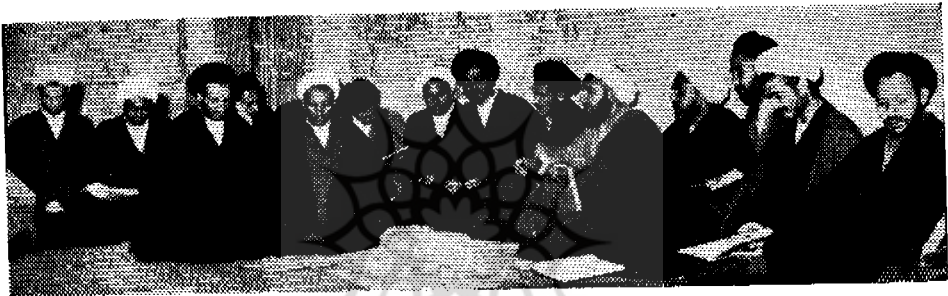
جلسه درسی از آقایان طلاب علوم دینی در مدرسه نواب

اول خادم برای داخله حرم دوم فراش جهت بیوتات متصله بحرم محترم سوم دربان بمنظور حفظ ابواب طلا و نقره و درهای دیگر عمارت آستان قدس رضوی و رسیدگی بامور صحنین و انتظامات آنجا و این سه گروه در هر پنج شبانه روز یکنوبت بخدمت مرجوعه مفتخر و مشرف می‌شده‌اند و هر نوبت را باصطلاح زمان صفویه کشیک مینامیده‌اند پس خدام و فراشان و دربانان آستانه در پنج کشیک و هر پنج روز یکنوبت از اول آفتاب روز خدمت تا اول آفتاب روز بعد یکسره بخدمت اشتغال داشته‌اند و در رأس هر کشیک یک نفر بنام سرکشیک گمارده میشده و سرکشیک هر نوبت تمام امور یکشنبه روزی داخله حرم و بیوتات و صحنین وارد و