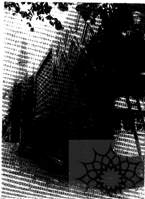
نمای ساختمان مسجد نیمه تمام هامبورگ

اخذ وام از بانك «برينكمان ويرتس هامبورگ» بنای اسكلت مسجد باتمام رسيد واينك بيشتر از هفت ماه است كه آقای محققى سرپرست تبليغات اسلامى بواسطه نرسيدن بودجه، در ايران بسر ميسرند، هفتصد متر زير بنای مسجد در نهايت استحكام ساخته شده و تاكنون طبق اسناد مثبتة ۱،۴۰۰،۰۰۰ مارك خرج شده كه از اين مبلغ ۱،۲۰۰،۰۰۰ مارك تاديه شده و فعلا ۱۷۲ هزار مارك بيبانك «برينكمان ويرتس» و ۲۷ هزار مارك بموسسات ساختمانى مفروض هستند .