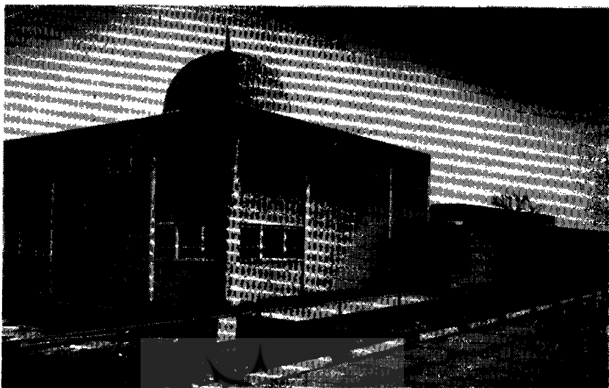
نمایی از مسجد شیعیان در آمریکا