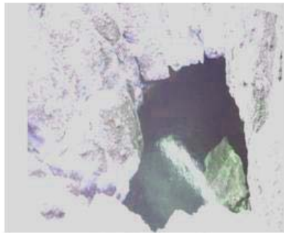
تصویر شماره ۶: دولین