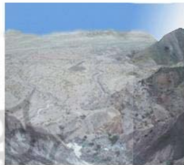
تصویر شماره ۷: کویر نمک