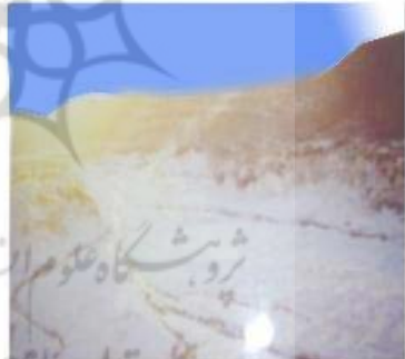
تصویر شماره ۹: چشمه های نمکی