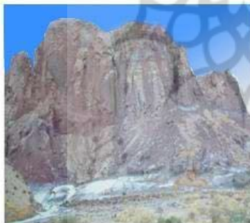
تصویر شماره ۱۰: دیواره های گچی نمکی