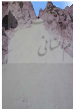
تصویر شماره ۴: آبشار نمکی