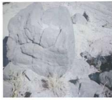
تصویر شماره ۵: پوش سنگ