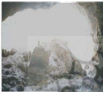
تصویر شماره ۸: غار نمکی