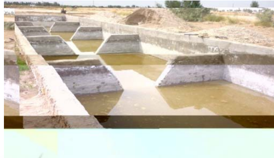
شکل ۲. تصویر چاهک و استخر ذخیره آب در روستای کفتارگی ۱ شهرستان زهک