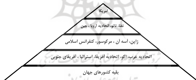
شکل ۱. ساختار هرمی نظم جهانی مورد نظر ایالات متحد امریکا

با فروپاشی شوروی و پایان جنگ سرد، الگوی نظام سیاسی جهان دگرگون شد و جهان در دوران گذار استراتژیک قرار گرفت. ایالات متحد به عنوان پیروز عصر جنگ سرد، دکتین بوش با عنوان «نظم نوین جهانی» را مطرح ساخت و خود را مدیر و گرداننده این نظم دانست (Hendrickson, 2001, 130). اشغال کویت از سوی صدام حسین فرصت لازم را برای طرح ایده «نظم نوین جهانی» فراهم کرد (حافظنیا، ۱۳۸۵، ۵۳-۵۲). جرج بوش پدر در سخنرانی خود در این زمینه چنین گفت: «ما امروز در حرکتی یکپارچه و فرامرزی قرار گرفته‌ایم. بحران خلیج فارس با این عظمتی که دارد، مجالی کوتاه برای حرکت به سوی دوره‌ای تاریخی از اتحاد است. خارج از این موقعیت مسئله‌ساز نظم نوین جهانی می‌تواند ظهور کند (بوش، ۱۳۸۰، ۳۰۵). در این میان سیاستمداران و صاحب‌نظران سیاسی امریکایی سعی در پدید آوردن نظام تک‌قطبی تازه‌ای داشتند که ایالات متحد در ساختار سلسله‌مراتبی آن، در رأس هرم قدرت قرار گیرد و با استفاده از نهادهایی چون شورای امنیت سازمان ملل متحد به عنوان پارلمان جهانی مشروعیت‌دهنده بین‌المللی در مقام قانون‌گذار، هیئت داور، و مجری حکم در سطح جهانی نقش‌آفرینی کند (شکل ۱) (مجتهدزاده، ۱۳۷۹، ۸۶). در این دکتین، امریکایی شدن جهان و جلوگیری از به وجود آمدن ابرقدرت رقیب از اهداف اصلی سیاست خارجی امریکا شمرده شد و عملیات نظامی پیشگیرانه، که می‌تواند ضامن اجرایی این اهداف باشد، بلامانع تلقی گردید (Hendrickson, 2001, 130).