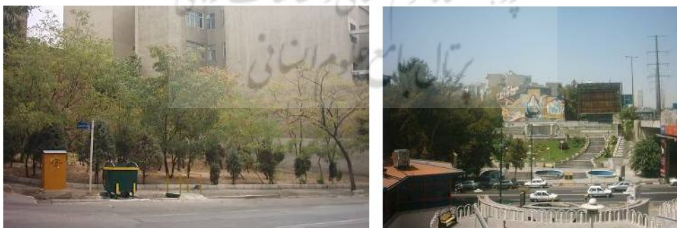
شکل ۳. تصاویری از موقعیت و کاربری‌های فعلی سایت‌های پیشنهادی