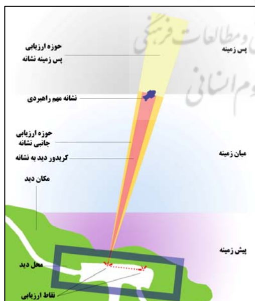
تصویر ۱. اجزای یک دید راهبردی منتخب،

تصویر ۱. اجزای تعریف شده برای هر کدام از دیدهای راهبردی منتخب طرح را به تصویر می‌کشد.