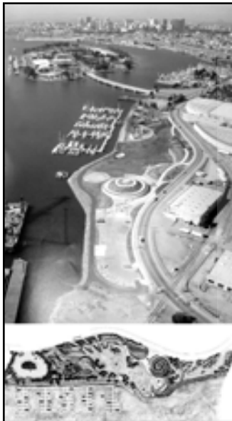
تصویر ۶. ایجاد محدوده امن برای شنا و قایقرانی و زنده و پویا کردن منطقه صنعتی کالیفرنیا اُکلند با ایجاد یونیون پارک (Union Point Park).