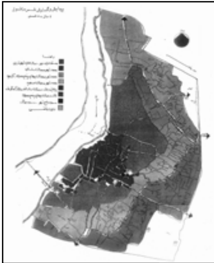
تصویر ۲. پیدایش و گسترش شهر دزفول در دوره‌های مختلف در کنار رود دز (رودخانه نوع اول). مأخذ: نعیم، ۱۳۷۶: ۷۱

۳.۳. رودخانه‌هایی که رالخی ۱ در اثر رشد شهر، به عنوان یکی از عناصر موجود در شهر مطرح شده‌اند عملاً ۲ هیچ‌گونه نقشی در شکل‌گیری‌های اصلی شهر نداشته‌اند، مانند؛ ساری، گرگان و همدان.