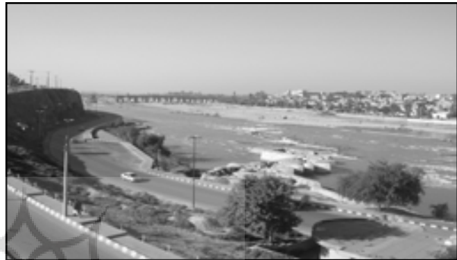
تصویر ۱. نمایی از کناره‌های بدون طراحی و آسیاب‌های در حال تخریب رودخانه دز - دزفول