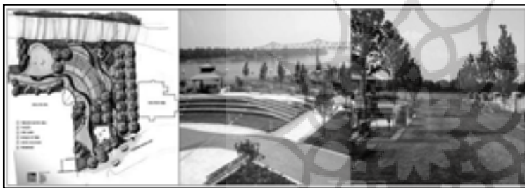
تصویر ۴. تبدیل کانسبت اولیه به فضای قابل استفاده برای تفریح در کنار روخانه اونسبرو (Owensboro)، ایالت کنتاکی (Kentucky)، آمریکا.