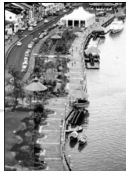
تصویر ۳. امکان پرسه زدن و حاکمیت پیاده در کنار رودخانه کوچینگ (Kuching) در ایالت ساراواک (Sarawak)، مالزی.