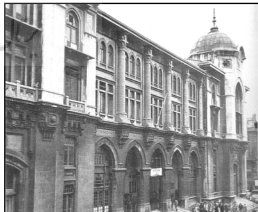
تصویر ۱. اداره پست مرکزی، اثر ودات تک، استانبول، ۱۹۰۹