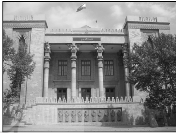
تصویر ۹. کاخ شهربانی (وزارت امور خارجه فعلی)، اثر قلیچ باغلیان، تهران، ۱۳۱۵

همانطور که گفته شد معماری ایران در دوره بیست ساله پهلوی اول با توجه به تحولات و نفوذ اندیشه‌های معماری مدرن غرب بستر ظهور و شکل‌گیری چندگونه متفاوت در معماری به طور همزمان بوده است: