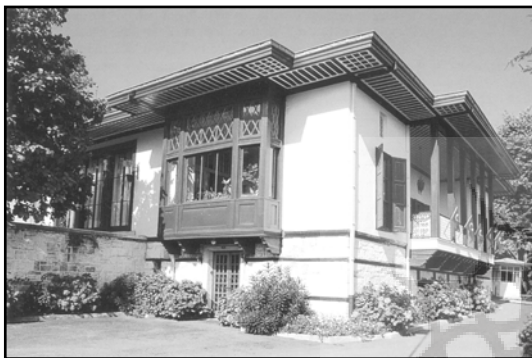
تصویر ۶ خانه گوررونو ۳۷ (اقامتگاه فرماندار). اثر اونات، بورسسا ۳۸

سومین رویکرد، روندی است که به جستجوی ملی‌گرایی در ترکیب عناصر منطقه‌ای و اصول منطقی (فردگرا) می‌پردازد. این رویکرد در واقع سعی می‌کرد پیشینه معماری شهرهای آناتولی را جایگزین جغرافیای عثمانی نماید. در این راستا یک گروه از کارکنان دانشکده معماری دانشگاه فنی استانبول مطالعات قوی روی موضوع معماری خانه‌های آناتولی انجام دادند. (تصویر ۶)