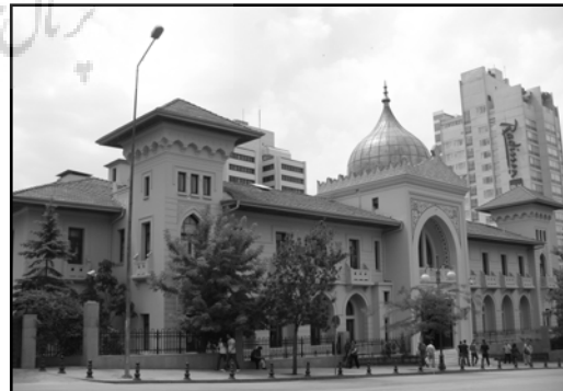
تصویر ۳. هتل پالاس، اثر ودات تک و کمال الدین بیک، آنکارا، ۱۹۲۷ عکس: ج. سهیلی، ۱۳۸۹