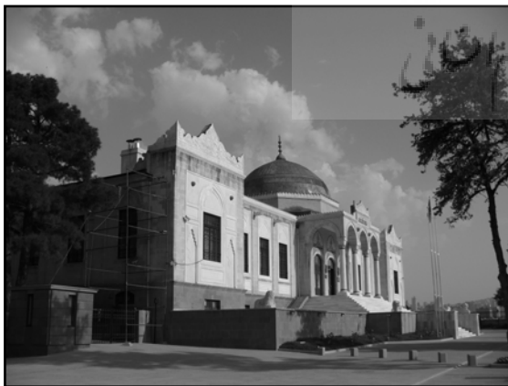
تصویر ۲. موزه مردم‌شناسی، اثر عاریف حکمت بیگ، آنکارا، ۱۹۲۸.

تقریباً بیشتر ساختمان‌های ساخته شده در این دوره از ویژگی‌های طراحی معماری عثمانی تبعیت می‌کرد. تعدادی از نمونه‌های اصلی پروژه‌های ساخته شده با ویژگی‌های احیاءگری معماری عثمانی بین سال‌های ۱۹۲۳ تا ۱۹۲۸ را می‌توان در تصاویر ۲ و ۳ مشاهده کرد.