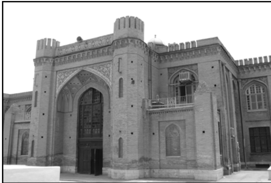
تصویر ۸. کالج آمریکایی‌ها (دبیرستان البرز)، اثر لئون مارکوف، تهران، ۱۳۰۴. عکس: ج. سهیلی، ۱۳۸۹.