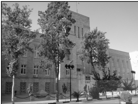
تصویر ۱۰. وزارت امور خارجه، اثر گابریل گورکیان، تهران