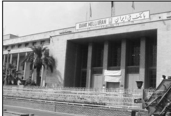
تصویر ۷. بانک ملی ایران، اثر محسن فروغی، بازار تهران عکس: ج. سهیلی، ۱۳۸۹.