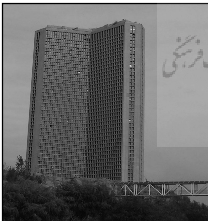
تصویر ۳. برج (بین‌المللی) تهران

این برج (تصویر ۳) در میان ۴ بزرگراه مهم شهر و در ضلع شمالی بزرگراه حکیم واقع شده است، به گونه‌ای که از غرب به بزرگراه شیخ بهایی جنوبی و از شرق به بزرگراه کردستان با دسترسی مناسب به نقاط مختلف شهر بزرگ تهران مشرف است. برج (بین‌المللی) تهران با زیربنای کل ۲۲۰،۰۰۰ متر مربع، و سه بال پهناور در ۵۶ طبقه، مشتمل بر ۵۷۲ واحد و ۱۷ واحد تجاری در همکف است.