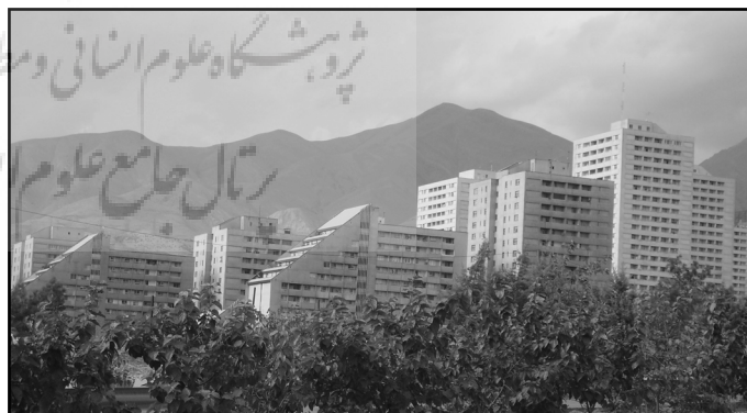
تصویر ۲. مجتمع مسکونی آتی‌ساز، مأخذ: کریمی مشاور

بر اساس آنچه در بخش معیارهای ارزیابی شرح داده شد، ارزیابی تطبیقی میان دو برج (بین‌المللی) تهران و مجتمع مسکونی آتی‌ساز بر اساس سه هدف عمده منظر شهری، به عنوان معیارهای اصلی، و معیارهای فرعی هرکدام از آنها در جدول زیر (جدول ۲) ارائه شده است: