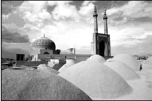
تصویر ۱. اهمیت معنایی ابنیه بلند به عنوان نشانه شهری در بافت قدیمی.

اهمیت است، زیرا به این وسیله شخصیت یک شهر معرفی می‌گردد. علاوه بر این، بحث نمادها و سمبل‌ها در خلق ابنیه بلند به عنوان نقاط شاخص یک شهر نیز دارای اهمیت است، زیرا مردم باید بتوانند با این نمادها و سمبل‌ها به عنوان نشانه‌های شهری ارتباط برقرار نمایند.