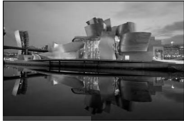
تصویر ۱. موزه گوگنهایم گری

در هر دو آثار می‌توان چیره‌گی خواست هنرمند بر جامعه، نیاز مردم و طبیعت را دید. گویی این آثار تنها در جهت معرفی خود و معمار خود ساخته شده است. در "جامعه وفور نعمت"، معماری حتی از منطق عمومی و کارکردی و... نیز فاصله می‌گیرد و نقش معیارهای وحدت بخش اجتماعی بسیار کم‌رنگ می‌شود.