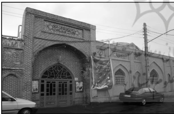
تصویر ۵. ب. مسجد مقصودیه تبریز.

در واقع بحران معماری امروز ناشی از کمبود خلاقیت نیست، بلکه از کمبود مبانی نظری ما نشأت می‌گیرد. مبانی که روزگاری قدرتمندانه در وجود ما ریشه داشت و اکنون بر اثر غفلت و ناسپاسی خود آنها را از دست داده‌ایم. در واقع آنچه ضامن بقا و جاودانگی این میراث تمدن معماری شده است، عدم اتکاء آفرینش‌های هنری، آفرینندگانشان و انتساب آن به خالق هستی‌بخش در کنار توجه متعادل به تمام ابعاد مطرح در معماری است.