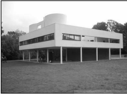
تصویر ۲. ویلا ساوای لوکوبورزیه

تا به امروز ماندگار بوده لزوماً جاودانه نیست و گاه تنها به عنوان یک میراث فرهنگی مرده و غیرفعال باقی مانده و شاید در آینده هم ماندگار باشد ولی حیات جاودان نداشته باشد. مطابق برخی تحلیل‌ها اگر چه اهرام اصول معمارانه جاودانه‌ای را به نمایش گذاشته، ولی بر اساس استبداد و فرعونیتی غیراجتماعی و غیرانسانی تحت فشار شکل گرفته است و به همین جهت هرچند ماندگار اما غیر جاودانه است.