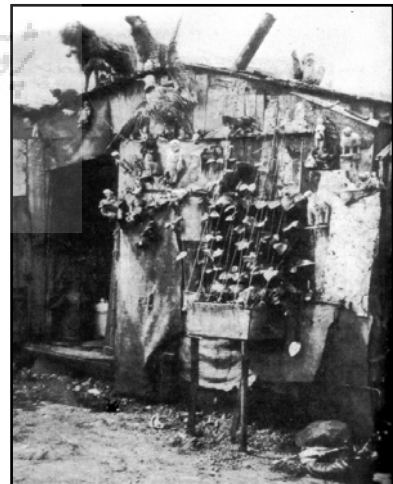
تصاویر ۴. آثار ماندگار در دیدگاه الکساندر.

الکساندر هر دو آثار را به یک اندازه ماندگار می‌بیند ولی این نکته را فراموش می‌کند که تصویر سمت چپ در میان عام و خاص مورد تقدیر است و تصویر سمت راست تنها در ذهن مالک خود. او بین جاودانگی در ست عظیم اجتماعی و معنوی و خاطره‌انگیزی در ذهن اشخاص تمایز قائل نیست و آنها را از یک جنس می‌انگارد. در واقع توجه او در این موارد بیش از کالبد معماری متوجه رویداد و رفتارهایی است که در یک فضا رخ داده و آن را ماندگار می‌کند. سمت چپ مقبره عطار در نیشابور و سمت راست یک کلبه ساده یک حاشیه نشین که بر اساس سلیقه خود چیده است [الکساندر، ۱۳۸۶ : ۳۰۴، ۳۳۸].