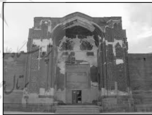
تصویر ۵. الف. مسجد کبود تبریز.

هر دو آثار را می‌توان جزء آثار جاودان به حساب آورد. اما آنچه موجب جاودانگی هر دوی اینها شده است، توجه به تمام ساحات معماری در طراحی و ساخت آنها است. اگر چه میزان توجه به این عوامل در هر یک متفاوت است به طوری که اولی با گرایش غالب نخبه‌پسند و دومی با گرایش غالب عام‌پسند شکل گرفته است. لازم به ذکر است هر جامعه‌ای به هر دو نوع آثار احتیاج دارد.