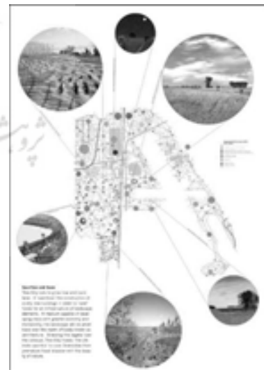
تصویر ۲. پارک داونس ویو، اثر رم کولهاس، تورنتو، ۲

دیگرام های جزئی از سکونت حیوانات، نظام های کاشت، نظام های هیدرولوژیکی، رژیم ها و روش های برنامه ریزی که دفتر طراحی «فیلد اپریشن» (Field Operations) به سرپرستی جیمز کرنر و استان آلن در پروژه پارک «فرش کیلز» برای مداخلات