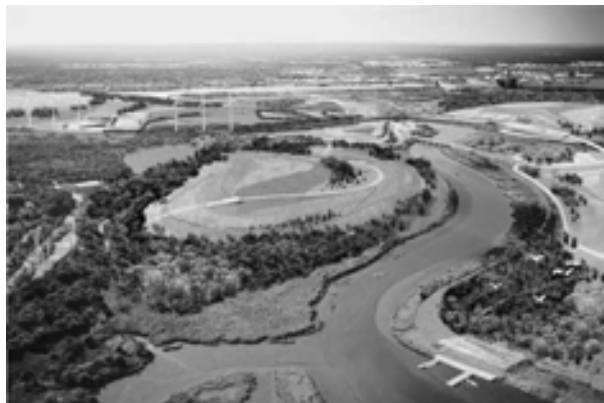
تصویر ۳. پارک فرش کیلز، نیویورک، لایه های پوشش گیاهی، زیست جانوری و انسانی در موازنه با نظام اکولوژیکی اثر جیمز کرنر و استان آلان ۱۹۹۹

اکولوژیکی در نظر گرفتند، همگی بر مبنای الگوی پیشنهادی مک هارگ در کتاب «طراحی به کمک طبیعت» قابل توضیح است. این پارک را شاید بتوان اولین پروژه با مقیاس بزرگ در حوزه شهرسازی منظر پس از پروژه های داونس ویو و دولویل نام برد. در حقیقت طرح تهیه شده به مثابه یک طرح جامع سه بعدی (Master Plan) انواع لایه های پوشش گیاهی، زیست جانوری و انسانی را مدنظر قرار داده است.