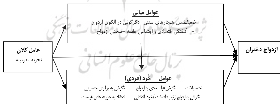
شکل (۱): مدل نظری کلان تحقیق

به دلیل خصلت چندبعدی اپتیماهای و انسانی، و تکثر نظریه‌های متعدد در خصوص زوایای گوناگون ازدواج دختران، سعی گردید از طریق گزینش تلفیقی بهینه از نظریه‌های مرتبط و مقتضی، به شناخت و تبیین بهتری از دلایل افزایش سن ازدواج دختران و همچنین پیامدهای بروز پدیده تجرد قطعی برای آنان دست یابیم. همین روی، چارچوب نظری انتخابی این تحقیق، تلفیقی از بررسی ادبیات نظری و تجربی تحقیق بوده است. بدین معنی که در این تحقیق، نظریه‌های اقتصادی، اجتماعی، جمعیتی و نوسازی با توجه به متغیرهای اصلی چارچوب‌ها هدایت نظری تحقیق انتخاب شده و سایر مراحل تحقیق براساس این رویکردها پی‌گرفته شده‌اند. مدل زیر ساخت روابط بین متغیرهای تأثیرگذار بر سن ازدواج را براساس کلید متغیرهای این نظریه‌ها نشان می‌دهد. در این تحقیق، سعی گردید تا این مدل نظری مورد آزمون عملیاتی قرار گرفته و صحت و سقم ارتباط متغیرهای مستقل با ازدواج دختران آزمون شود البته در آزمون این مدل، از آنجا که تعداد متغیرهای مطرح شده در سه حوزه کلان، میانی و خرد بسیار زیاد می‌باشند و در نتیجه امکان سنجش تمامی آن‌ها در یک تحقیق عملی نمی‌باشد و از دقت سنجش کاسته می‌شود، در تحقیق حاضر، حدود و ثغور تحقیق را به عوامل خرد معطوف نموده و سعی گردید متغیرهای فردی به صورت دقیق سنجیده شده و نوع و جهت روابط آن‌ها با متغیر وابسته تحقیق (ازدواج دختران) آزمون گردد (بشکل ۱). تحلیل متغیرهای سطوح میانی و کلان، از دستاوردهای نظری تحقیق استفاده شده است (شکل ۱).