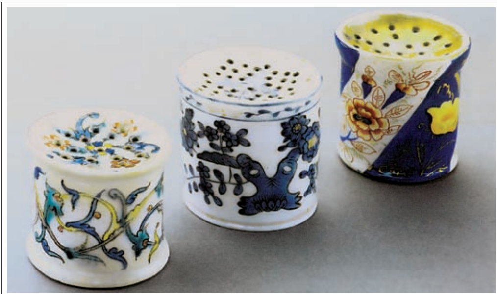
■ آلات چینی که از آنها احتمالاً برای افشان ورقه‌ی زر استفاده می‌شده است. ارتفاع آنها از راست به چپ: ۲/۲، ۲/۴ و ۲ اینچ (۶، ۷/۵، ۱/۵ س.م).