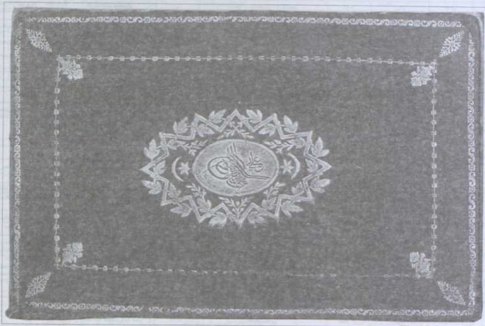
جلد تیماج عثمانی ساز، یا سجع میر «عدلی محمود خان بن عبدالحمید» (کتابخانه مرکزی و مرکز اسناد دانشگاه تهران، ش ۹۶۹۳)

دو نسخه دیگر که مرغوب‌تر هستند یکی جنات الوصال نورعلیشاه است (ش ۴۷۳۱) که جلد آن با گل و مرغ آراسته شده است و دورتادور حاشیه آن اشعاری در ستایش