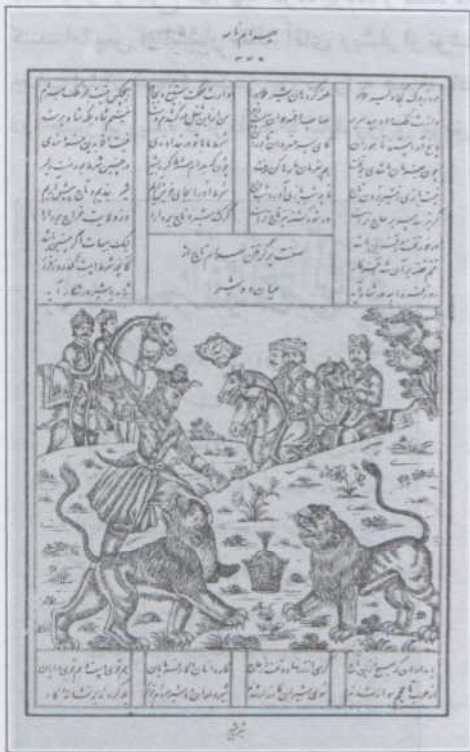
تصویر ۲: نمونه‌ای از سیاه قلمکاری‌های میرزا جواد.