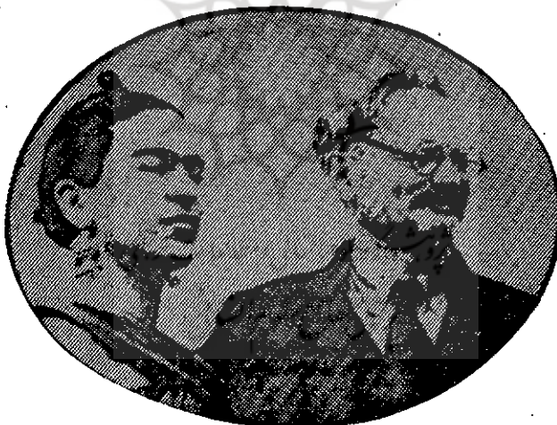
Frida and Trotsky, 1937.