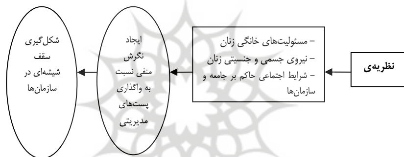
شکل (۱) مدل استخراج‌شده بر اساس نظریه‌ی نئوکلاسیک

فقدان دقت بالایی هستند و منعکس‌کننده‌ی دقیق تفاوت‌های زنان و مردان نیز نیستند (آلن، ۱۹۹۵: ۴۸۹). مجموعه‌ی این فرایندها سبب می‌شود تا وضعیت موجود کاملاً طبیعی به نظر برسد و به‌عنوان روند عادی زندگی کمتر در مورد آن سؤال شود.