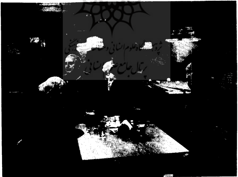
صحنه‌ای از فیلم گل‌های سرخ برای آفریقا