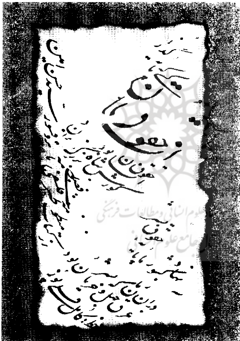
خط از کامل قلی‌پور