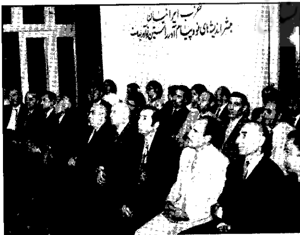
گروهی از ستانورها و نمایندگان مجلس و اعضای حزب ایرانیان در یکی از جلسات هفتگی حزب در تالار اجتماعات حزب

همان‌گونه که قبلاً بیان کردم، جنبش پان‌ایرانیسم از آغاز پیدایش تاکنون سه مرحله‌ی تکاملی را از نظر فکری و تشکیلاتی پشت سر گذاشت. تا پایان حکومت دکتر مصدق و جریان ۲۸ مرداد ۱۳۳۲ کوشش‌های پان‌ایرانیست‌ها فقط دور سه محور بود. محور اول طرح هدف‌های ملی و سخن گفتن از پیشینه‌ی تاریخی و پُرافتخار ایرانیان در قالب ملت‌گرایی، ملت‌دوستی «ناسیونالیسم»... و تجزیه‌ی ننگین و خفت‌بار ایران بزرگ در دویست سال اخیر. محور دوم مبارزه‌ی سخت و بی‌امان با