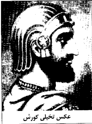
عکس تخیلی کوروش

فریبکاری خوانده شد. آیا اگر به مسیحیت گرویده بود، جستجوی عاری از دورویی و ریا خوانده نمی‌شد؟ اگر موبدان او را یزدگرد بزهدار خواندند و به احتمالی با همدستی بزرگان مخالف نقشه‌ای برای قتل او طرح کردند، بی‌شک به خاطر همین میل به تسامح بود که برای کاهنان قابل تحمل نبود. جوابی هم که هرمزد- پسر خسرو اول- در جواب موبدان داد و در آن درخواست آن‌ها را برای اعمال تضییق