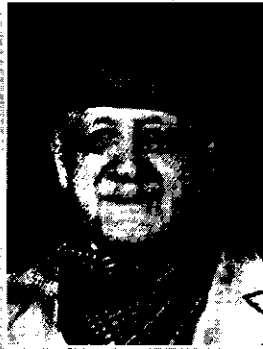
دکتر عبدالحسین زرین کوب

اگرچه دنیای باستانی ایران که از آغاز عهد ماد و تا پایان عصر ساسانیان، چهارده قرن رویدادهای پرخطر را-جز در ماجرای کوتاه اما خونین اسکندر- به آسانی و بی‌زیان عمده‌یی از سر گذرانیده بود و هم‌چنان بالان و نازان در سر جای خویش بالی مانده بود، تاگهان در مقابل یک ضربتی نابه‌هنگام و نفس‌گیر، آن هم از جایی که هیچ از آن‌جا احساس بیم و خطر نمی‌کرد، از پا درآمد. باز کارنامه‌ی روزگاران گذشته‌اش، مثل شمارنامه‌ی عمر یک پهلوان پیر، بر از خاطره‌های خوش، نشانی‌های افتخار و یادگاری‌های غرورانگیز بود.