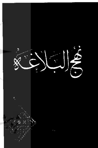
● نهج البلاغه ● ترجمه علی شیروانی ● قم، دارالعلم، ۱۳۸۳

می‌گذارد که هرگز امکان امحای آن از صحنه درون و بیرون زندگی باقی نمی‌ماند. اگر کسی خود را در اختیار نهج البلاغه قرار دهد ناخود آگاه در مسیری قرار خواهد گرفت که چند مقوله اساسی برای بهتر زیستن آویزه گوش ظاهر و باطن او خواهد بود؛ توحید، عدالت، آزادی و امنیت. جالب توجه اینکه این مقوله‌ها از چنان عمیقی برخوردار می‌شوند که به سهولت از جان و دل آشنای نهج البلاغه نخواهد رفت. کسانی که عمری در راه فهم و گسترش آموزه‌های این کتاب شریف سپری کرده‌اند شاهد گویایی بر این مدعا هستند. مترجمان نهج البلاغه از این دسته‌اند. اما شگفتنا که در فرهنگ عامه این مرز و بوم تسامح بی‌محل و شعارزدگی باعث شده دوستان اران علی (ع) سال‌ها بلکه قرن‌ها از آموزه‌های او بی‌بهره بمانند و در عوض فرهنگی بسازند که با آموزه‌های آن فرسنگ‌ها فاصله دارد! شگفت است که مردمی به نهج البلاغه و آموزه‌های آن باور داشته باشند اما فقیرانه زندگی کنند و در عمل و نظر اقدام به فقرزدایی نکنند؛ شگفتا اعتقاد به این آموزه‌ها با بی‌دقتی و تنبلی و نابسامانی زیست اجتماعی همراه شود! به هر حال از این شگفت‌ترین که در حوزه‌های علمی و آکادمیک هنوز این اثر ارزنده الهی - بشری به عنوان یک منبع شناخته نشده است و شیعیان بیش از دیگران نسبت به آن غریبی می‌کنند. در هر صورت باید پذیرفت که مترجمان این کتاب شریف از بدو تدوین آن در صدد برآمده‌اند تا فرهنگ این کتاب را در میان مردم جاری و ساری کنند و اگر امروز نام و یاد از این اثر ارزنده در میان است قطعاً مدیون زحمات این اندیشه‌ورزان است. به همین دلیل مناسب دیدیم گذری بر ترجمه‌های مهم این کتاب به زبان فارسی داشته باشیم تا در نهایت از آخرین ترجمه آن سخن به میان آوریم.