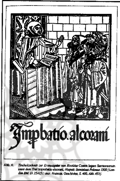
Abb. 4: Trüchelschnitt zur Erneuerung von Nicolaus Cusanus gegen Sebastianus unter dem Titel Impbatio alcorani. Hapud: Sebastianus Petrus 1507/London BM. (A 25412); aus: Haas, Geschichte, S. 402, Abb. 451.

قدرتمندی در شهر داشتند که مهمترین آنها حقوق‌دانی به نام بونیفاسیوس آمرباخ (Bonifacius Amerbach; ۱۵۶۲-۱۴۱۵) بود. ۴۰ استدلال‌های آمرباخ این‌گونه بود: کتاب‌های حاوی عقاید بدعت‌آمیز نمی‌بایست خوانده یا پخش شوند. نظر شورای وین (۱۳۱۱-۱۳۱۲) و فرمان مشهور آن در ایجاد کرسی مطالعات زبان‌های شرقی، ۴۱ نمی‌تواند به عنوان مستمسکی مورد استناد قرار گیرد. این فرمان به فراگیری زبان عربی اشاره داشته نه لزوم خواندن متون عربی یا ترجمه لاتینی قرآن، دیگر آن که، وضعیت روولین در چاپ تلمود با چاپ قرآن تفاوت داشته است. روولین در چاپ کتاب‌های یهودی فعالیت داشت که کاربردی برای مسیحیان داشت، به عنوان مثال در ادبیات تفسیری انجیل و مسائل مشابه. در حالی که آمرباخ چنین فوایدی را در قرآن نمی‌دید. مشکل چاپ تنها با پادرمیانی و وساطت مارتین لوتر حل شد. اقتدار وی، مهمترین دلیل برای چاپ قرآن بود. ۴۲ نامه‌ای که لوتر به شورای شهر بازل فرستاد ۴۳ ، حاوی استدلال جدیدی نبود که حامیان چاپ قرآن آرایه نکرده باشند. مقدمه‌ای که لوتر برای متن چاپ شده نگاشته است (که بر متن چاپ شده، افزوده نشده است) ۴۴ ، نیز حاوی مطلب جدیدی نیست. آنچه که لوتر درباره قرآن می‌دانست در کتابی مشابه یعنی ترجمه تلخیص گونه ردیه ریکالدو دومونته کروچه که لوتر