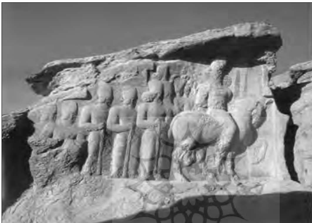
◀ نقش رستم فارس، پیروزی بهرام دوم، پادشاه ساسانی، از کتاب ایران زمین، جیمز ویت و جمیله حیدری.

متون پهلوی ساسانی و اشکانی و نیز عربی و آرامی و امثال آن قرار می‌گیرد. در همه جا نیز مرجع اطلاعات ذکر می‌شود. از آن جایی که صورت اصلی این بحث تاریخی است، متأسفانه چنین کنکاش‌های لغت‌شناسانه‌ای موجب شده است مقصود اصلی نویسنده از نظر دور بماند. چنانکه اگر قسمتی از چنین مباحثی در حاشیه یا تعلیقات کتاب واقع می‌شد، اصل متن بهتر در برابر دید خواننده قرار می‌گرفت. از سوی دیگر فروغ‌لطیدن در مباحث لغوی موجب شروع یک بررسی صوری و فارغ از جنبه‌های زمانی و مکانی، چه برای لغات و چه برای رویدادهای مرتبط با آن‌ها شده است. این امر خلاً عجیبی از نقد تاریخی را در کتاب موجب می‌شود. با امید به این که مباحث این کتاب برای قرون بعدی نیز دنبال شود و پرسش‌های بسیاری که برای تحولات تاریخ ایران در قرون نخستین اسلامی وجود دارد پاسخ مناسب خود را بیابد. زیرا تا حدود زیادی به نظر می‌آید مطالبی که نویسنده با دقت و حوصله بسیار با مراجعه به منابع فراوان پیگیر آن‌ها شده است ناتمام مانده‌اند. با این حال این کتاب مزایا و فواید بسیار دارد و در جای خود بر بسیاری از آثار مشابه برتری نشان می‌دهد.