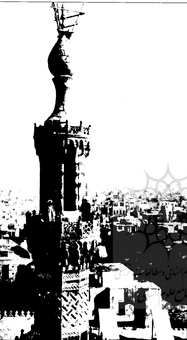
مناره مسجد الازهر قاهره،