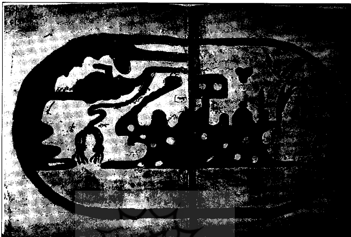
نقشه جهان، از ابن حوقل، از کتاب صورة الارض، قرن چهارم هـ. ق

یافته تر، رساتر، ساده تر و بیانی دقیق تر آراسته شده است.