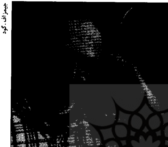
چیز آف گود

نهضت ملی نفت ایران مورد بررسی قرار گرفته است. از این لحاظ درکی عمیق، ملموس و واقع بینانه از این دوره، نصیب خواننده خواهد شد.