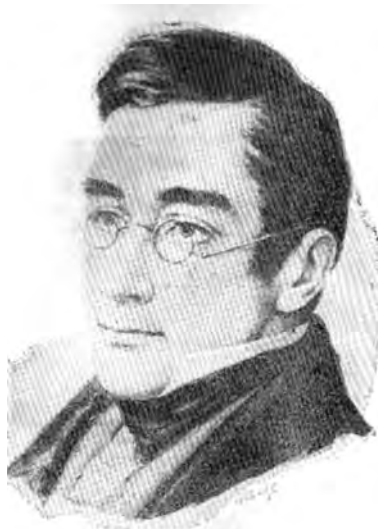
الکساندر سرگه‌یه‌ویچ گریبایدوف (۱۷۹۵-۱۸۲۹)

گریبایدوف ۲۳ ساله که از چهره‌های برجسته تئاتر پترزبورگ محسوب می‌شد آشنا گردید و روابط آن دو آغاز شد. گریبایدوف به دنبال انجام دولتی که در روسیه غیرقانونی بود، مجبور به ترک پایتخت شد تا به عنوان فردی نیمه‌تبعیدی برای تحقق اهداف امپریالیستی روسیه در ایران و قفقاز خدمت کند. گریبایدوف بعد از تبعید نقش بزرگی را ایفا نمود. از یک سواو بازیگردان اصلی روابط ایران و روس گردید و از سوی دیگر به عنوان یک نویسنده بزرگ که آثارش از شاهکارهای تئاتر روسیه محسوب می‌شود، شناخته شد. گریبایدوف بعد از ترک سن‌پترزبورگ به مدت پنج سال در ایران و گرجستان خدمت کرد. وی در ابتدا با عنوان (charge) در تبریز، پایتخت دیپلماتیک ایران، به خدمت مشغول شد. ولی بعد به مقام مشاور دیپلماتیک ژنرال یرملوف، منصوب شد. در واقع