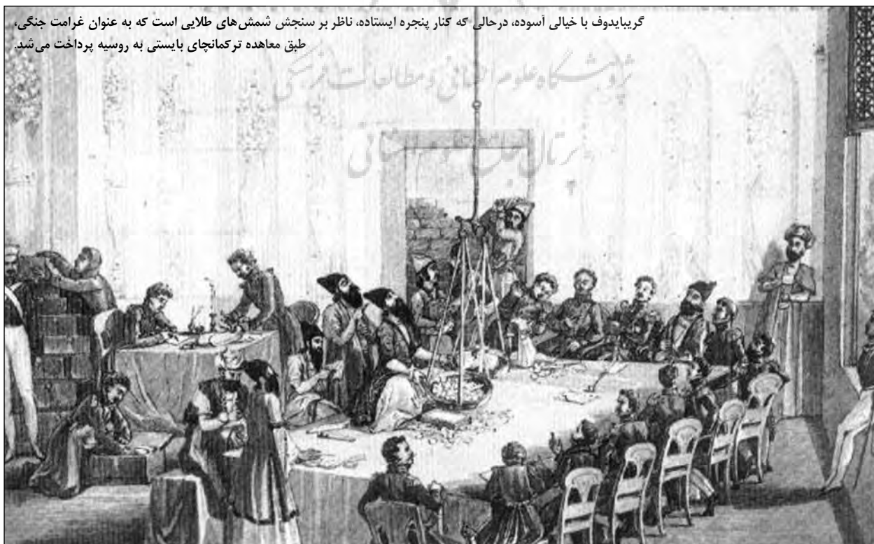
گریبایدوف با خیالی آسوده، درحالی که کنار پنجره ایستاده، ناظر بر سنجش شمش‌های طلایی است که به عنوان غرامت جنگی، طبق معاهده ترکمانچای بایستی به روسیه پرداخت می‌شد.

زندگانی سیاسی و ادبی گریبایدوف به طرز عجیبی به هم آمیخته شده است. در همین سال‌ها بود که طرح نوشتن مهمترین اثر وی با عنوان اندوه ناشی از فراست (Woe from Wit) شکل گرفت. گریبایدوف با ترک مسکو در بهار ۱۸۲۳، از تمامی دسیسه‌ها و تزویرهای اشراف روسیه آگاه بود. بنابراین در کمدی خود دغلاکاری‌ها و فرصت‌طلبی‌های آنان را به طرز درخشانی به باد تمسخر گرفت. این نمایشنامه نمایانگر تضاد میان دو جناح جامعه آن روز روسیه می‌باشد: در یک جناح جوانی را می‌بینیم به نام چاتسکی با اندیشه‌هایی تازه و گفتاری بی‌پرده و در جناح دیگر چهره‌های فرصت‌طلب که موردپسند و سلیقه طبقة اشراف و مرتجع آن روز روسیه