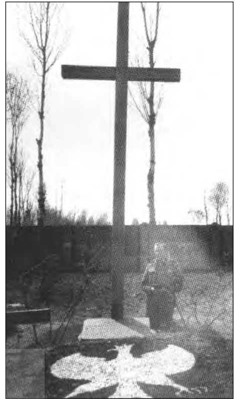
چند نمای نزدیک از قطعه لهستانی‌ها در گورستان ارمینیان، بندرانزلی، آوریل م ۱۹۴۲