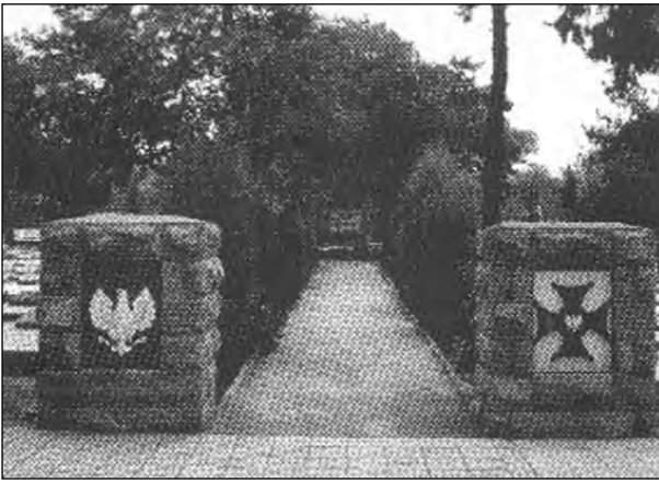
مدخل ورودی گورستان لهستانی‌ها در بندر انزلی