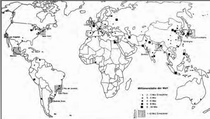
شهرهای بیش از دو میلیون نفر جمعیت جهان در سال ۱۹۹۰ (مأخذ: آمارهای ۱۹۹۰، United Nations)

نویسنده در کتاب خود با احاطه‌ی علمی بر مطلب، پایگاه جغرافیای شهری و برنامه‌ریزی شهری معاصر در ایران را از سرآغاز علمی آن به صورت جامع و همه‌جانبه مورد تجزیه و تحلیل قرار داده و با کاربرد تحلیل تکوینی، تحلیل ساختاری و تحلیل کارکردی، کیفیت هر دوره را به شکلی تطبیقی با جغرافیای شهری غرب به شکلی موشکافانه مورد ارزیابی قرار داده است