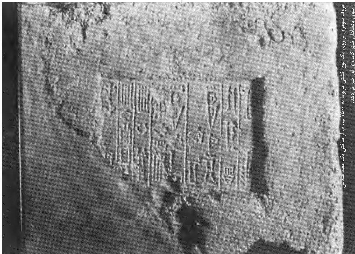
حروف سومی بر روی یک لوح خشتی مربوط به ۲۵۰۰ پ. م. از ساختن یک معبد مقدس از سوی پادشاهان شهر کامروای اور خیر نمی‌دهد.

آشور در زمان پادشاهی شمش‌ادی اول، در اواخر قرن ۱۹ و اوایل قرن ۱۸ پ. م، یک حکومت مقتدر شد. اما، دیری نپایید که زیر نفوذ بابلیان به رهبری حمورابی