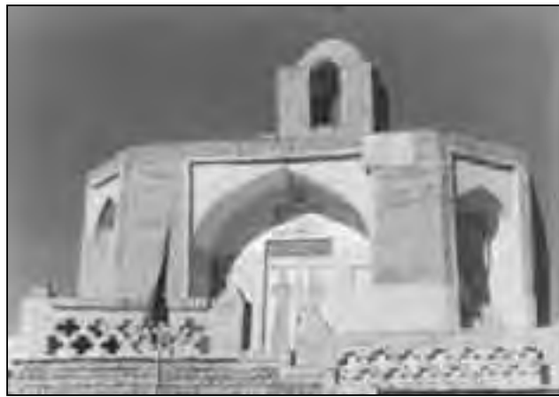
بیرجند - آرامگاه ابن حسام در خوسف

صنایع دستی، قالی و قالیبافی، صنایع ماشینی، معادن و فلزات.