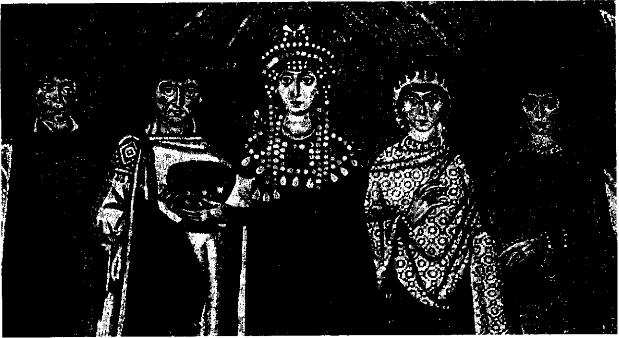
نقاشی روی موزائیک از آثار بیزانس - قرن ۶ - ایا صوفیا - تئودورا و همراهان

است حیرت کنیم که چرا پروکوپیوس می‌بایست کتابی می‌نوشت که قابل انتشار نبود. من در ذهن خود قانع شده‌ام که او امیدوار بود که کتابش منتشر خواهد شد. یقیناً هیچ نویسنده عاقل و موفقی که هفت کتاب درباره تاریخ منتشر کرده که هم مورد پسند عامه و هم مورد پسند شخصیت‌های ستایش شده ذی‌ربط بوده است، و نیز خیال دارد کتاب هشتمی به آن بیفزاید و سپس به نوشتن رساله‌هایی طولانی درباره معماری و احتمالاً به نوشتن اثری درباره امور کلیسا بپردازد، حاضر نیست وقت خود را با نوشتن کتابی هدر دهد که اگر منتشر نشود به هیچ کاری نخواهد آمد و اگر منتشر شود قطعاً به نابودی خودش خواهد انجامید. قطعاً آن کتاب فوراً قابل انتشار نبود، اما تئودورا مرده بود، و اگر جبار منفوری که شوهر او بود نیز در طی یکی دو سال در پی او می‌رفت، کتاب قابل نشر می‌شد و می‌توانست بسیار موفقیت‌آمیز باشد. یوستی نیان چندین سال بزرگ‌تر از پروکوپیوس بود و منطقاً می‌توانست ده یا بیست سال پیش از او بمیرد. مگر پیش از آن هرگز امپراتوری بوده است که نزدیک نیم قرن فرمانروایی کرده و هشتاد و دو سالگی در بستر مرده باشد؟ پس درک ناگهانی این واقعیت اندهیابار که یوستی‌نیان اهل مردن نبود می‌تواند دلیلی بر تصمیم او به رها کردن زبان دشنام و بازگشت به قطب افراطی دیگر شده و به نگارش کتاب ایتیه و انود کردن آن با چاپلوسی پرداخته باشد.