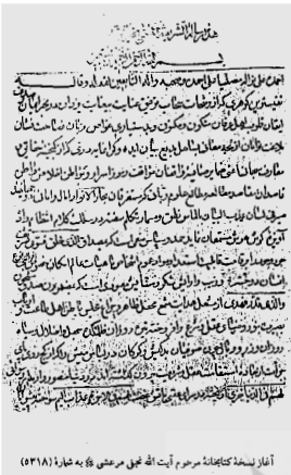
آغاز نسخه کتابخانه محرم آیت الله العظمی فاضل عیاضی (۱۳۱۸ ه. ق)

مؤلف برای معرفی شعرا و عرفا از دو روش استفاده کرده است نخست اینکه شرح برای شرح حال عرفا و صوفیان بزرگ از دو کتاب نفحات الانس من حضرت اقدس و کر عبدالرحمن جامی و تذکرة الاولیاء اثر عطار نیشابوری بیشترین استفاده را نموده است دوم با آوردن عباراتی از کتب ضد صوفی چون حقیقه‌الشیعه اثر مقدس اردبیلی، اصول کافی،