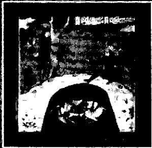
نویسنده: احمد کسروی

شهریاران گمنام یکی از تحقیقات ارزنده مورخ معاصر، احمد کسروی است. او با مطالعه بسیاری از کتاب‌های چاپی و دست‌نویس‌ها، توانسته است یکی از ماندگارترین تحقیقات تاریخی را از خود به یادگار نهد. آنچه بر اهمیت کتاب شهریاران گمنام می‌افزاید فقط اهتمام مؤلف در مطالعه آثار فراوان و گران‌بهایی نیست که در دسترس وی بوده - و یا او توانسته است با تلاش فراوان نسخه‌ای کمیاب از آن اثر را به دست آورد - بلکه آنچه ارزش این کتاب را بیش از پیش فزون می‌سازد کوشش غیرقابل توصیف مؤلف در نقادی و سنجش صحت و سقم مطالب مورد مطالعه است. او در مقایسه و تطبیق اسناد بین دو مورخ معاصر، به ارزیابی اسناد از دیدگاه و منظر «خرد» توجه داشته است. به همین جهت کتاب شهریاران گمنام برخلاف اکثر قریب به اتفاق نوشته‌های در دسترس، که تنها فیش‌برداری و پیوست اسناد را در بر گرفته است جایگاه قابل‌اعتنایی را به خود