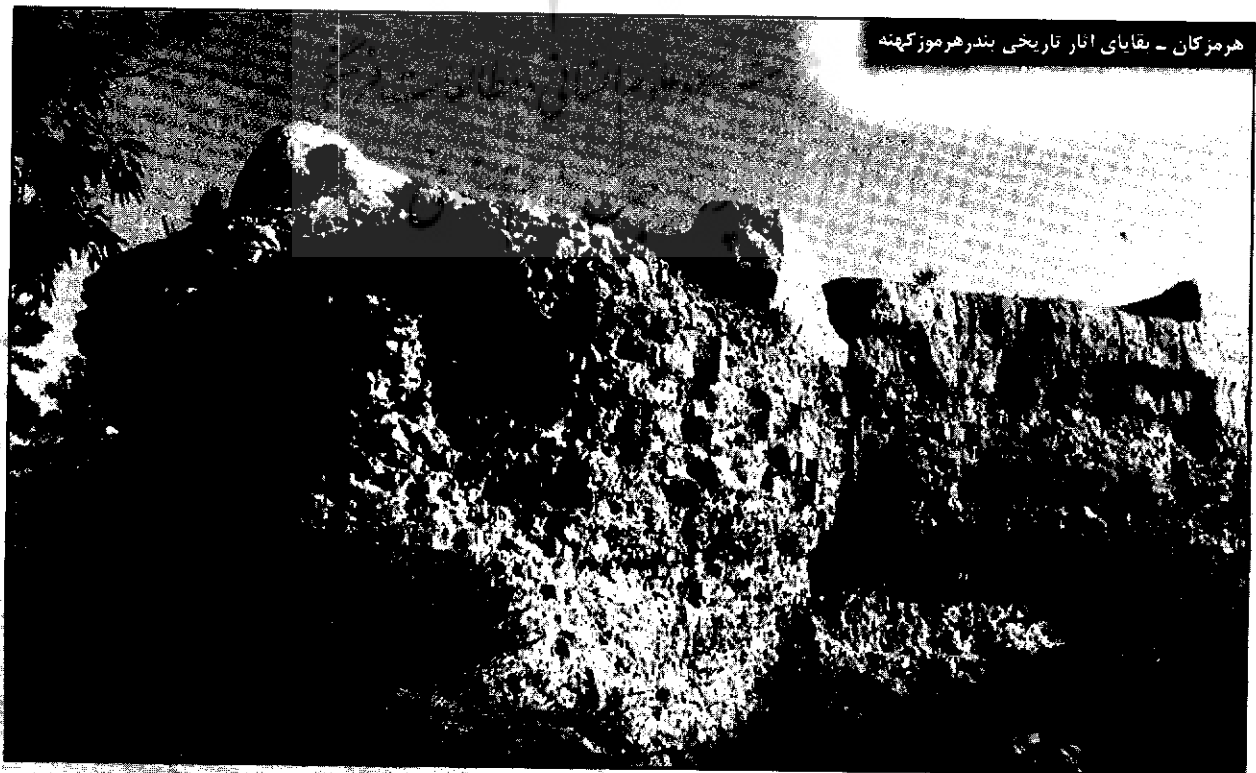
هرمزگان - بقایای آثار تاریخی بندر هرمز کهنه

او با حسرت از آن شکوه و عظمت یاد می‌کند «چه بسیار ملوک محتشم و سلاطین عظیم‌الشان در آن مقام و ملکش اقامت داشته و تاج بخشی‌ها فرموده‌اند و امروز تمام آنها در زیر خاک آرمیده و به چشم حسرت بر ما نگرانند.» ۱۲ و از این که جایگاه سلاطین عجم مرتفع و چراگاه دواب و چهارپایان شده به شدت افسوس می‌خورد، اما ناله او بر این ویرانه‌ها به جایی نمی‌رسد. سپس می‌نویسد: «افسوس از عدم اهتمامات امانت دولت علیه عنقریب از این آثار عظیمه نیاکان ما سنگی باقی نخواهی دید...» ۱۳ سدید در مورد نام شهرها و روستاها و وجه تسمیه و تاریخچه