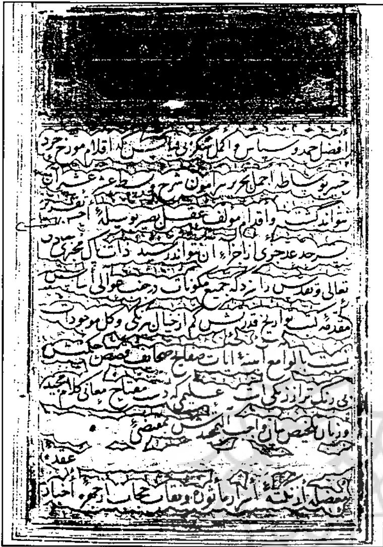
صفحه اول نسخه بریتانیا